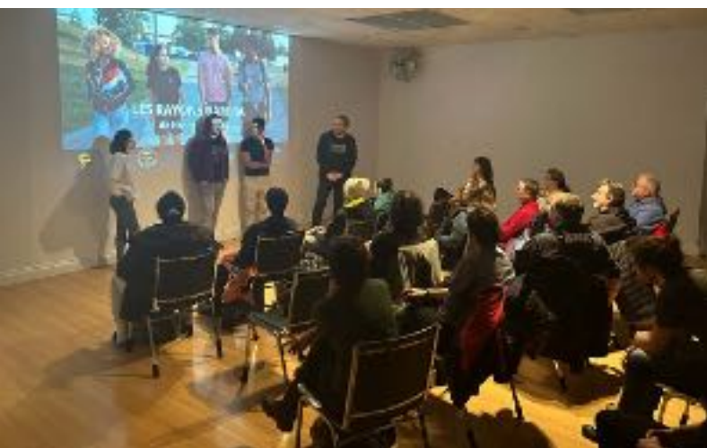
Présentation du film Les rayons gamma en présence du réalisateur et de trois des acteurs.