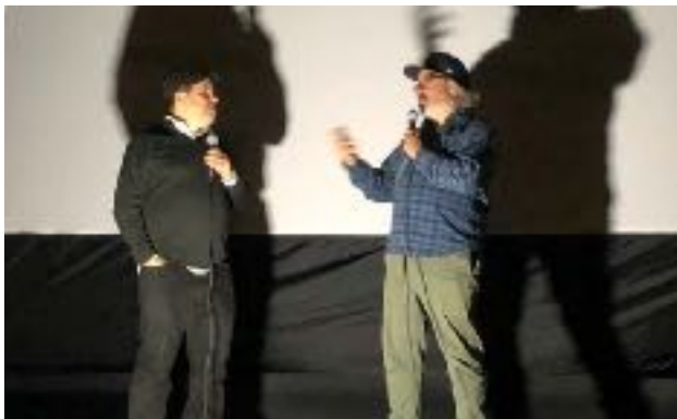
Le réalisateur Francis Leclerc (à droite) après la projection de son film Le plongeur .

Nous avons également présenté le film d'animation Le Petit Nicolas : qu'est-ce qu'on attend pour être heureux ? à l'Auditorium de Verdun dans le cadre de la programmation de la bibliothèque de plage de Verdun ; ainsi que deux projections en collaboration avec la Promenade Wellington sur le terrain du Presbytère de l'Église Notre-Dame-des-Sept-Douleurs, avec la présentation de Le dernier placard – Vieillir gai de Christian Lalumière dans le cadre des célébrations de la Fierté Gay de Montréal et un programme de courts métrages du festival Stop Motion de Montréal dans le cadre du Festival de Marionnettes organisé par la SDC Wellington.