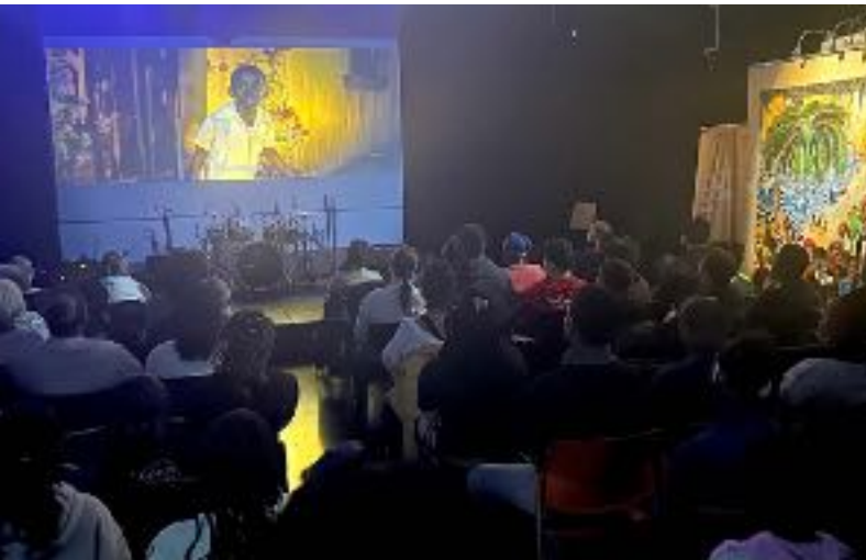
Présentation du film Kanaval au Centre des arts de la Maison d'Haïti

Nous avons présenté trois films au Centre des arts de la Maison d'Haïti et une animation en plein air au parc François Perrault. Trois artisans sont venus rencontrer le public lors des projections.