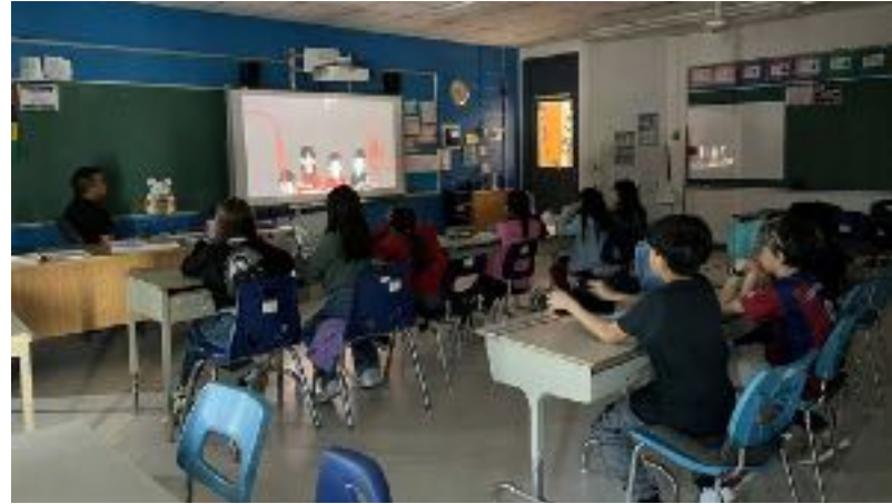
Présentation du documentaire Seul(s) à l'école primaire Marguerite de l'Île-des-Sœurs