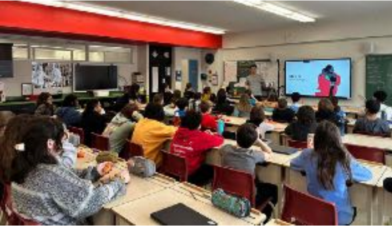
Présentation du documentaire Seul(s) à l'école Lévis-Sauvé de Verdun

Les commentaires que les jeunes de 5 e et 6 e années de l'école Lévis-Sauvé à Verdun nous ont fait parvenir étaient très encourageants. Leurs réactions au visionnement du film Seul(s) , dont voici quelques exemples, montrent bien la pertinence de leur présenter des Ciné-rencontres interculturelles en classe pour les sensibiliser à diverses réalités et enjeux.