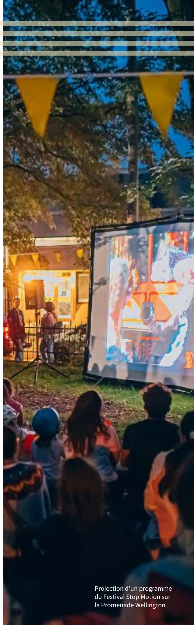
Projection d'un programme du Festival Stop Motion sur la Promenade Wellington