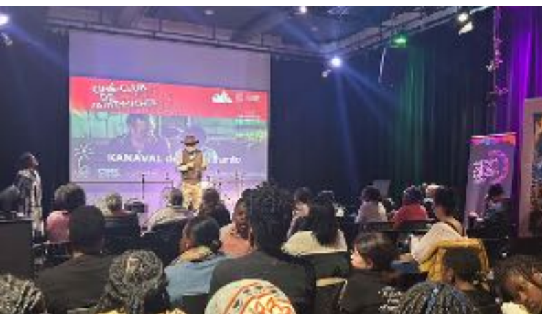
Discussion en salle après la présentation du film Kanaval au Ciné-Clud de Saint-Michel.

Chaque projection était animée et suivie d'une discussion, souvent avec les cinéastes des films ou des spécialistes des sujets abordés.