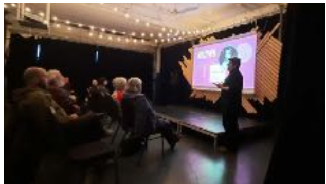
Présentation du film Richelieu à la Vieille Caserne de Verchères