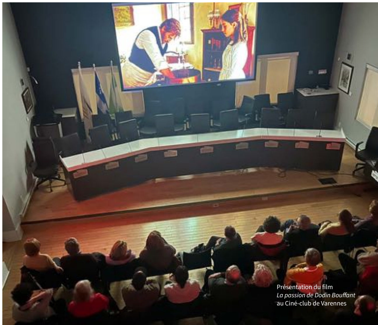
Présentation du film La passion de Dodin Bouffant au Ciné-club de Varennes